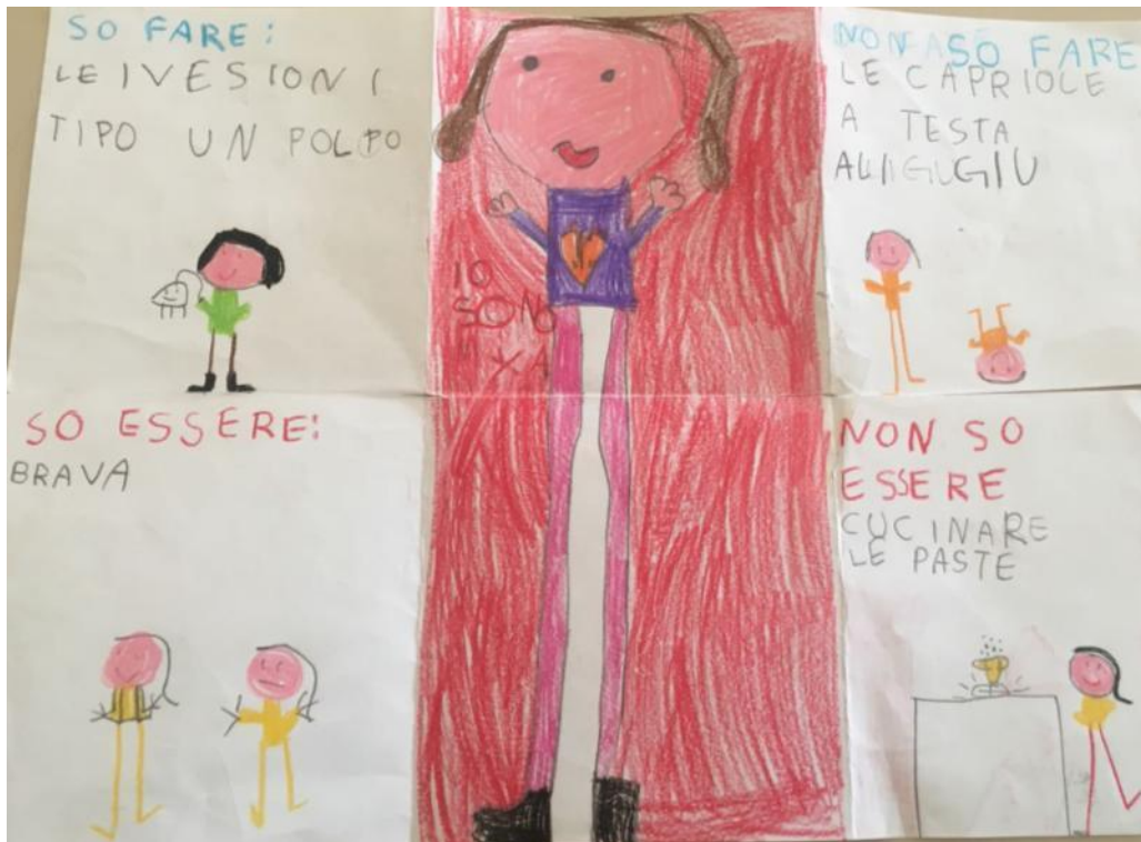
Condivisione del Lapbook "parlo di me".